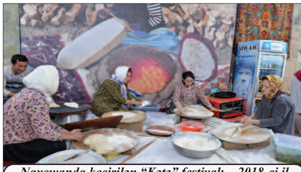
Naxçıvanda keçirilən "Kətə" festivalı – 2018-ci il

elimizin-obamızın mətbəx işləri, bişdüşləri, adətən, mərasim şəklinə olur. Kətə bişiriləndə də bir qonşunun həyatında təndir qalanır və digər qonşular köməyə gəlirlər. Özləri ilə hazırlayıb gətirdikləri xəmirəndə kətə bişirirlər.